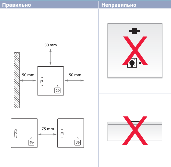
Мал. 2 Правильне положення